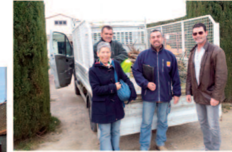
Achat de plants à la pépinière