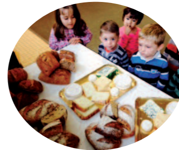
La semaine du goût

D'autres projets et actions seront menés par les enseignants en complément de cette liste, au cours de l'année scolaire.