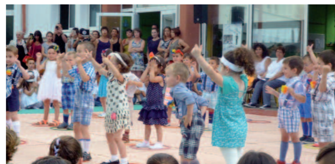
La fête des écoles