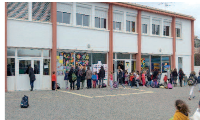
La grande lessive