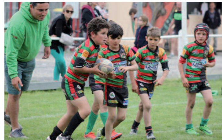
Pupilles en action