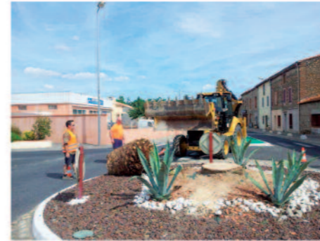
Nettoyage de la garrigue