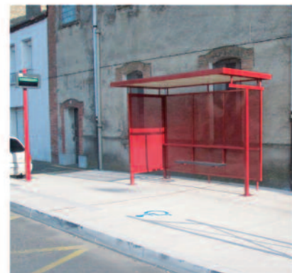
Mise en place de mobilier urbain