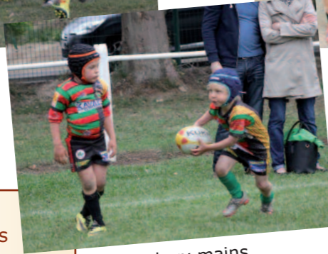
A deux mains