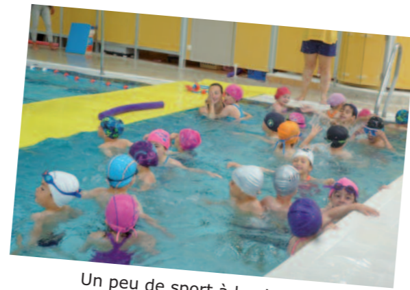
Un peu de sport à la piscine