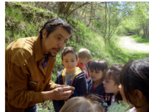
Un séjour à Mosset