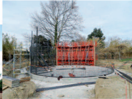
Travaux station d'épuration