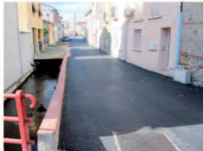
Réfection Rue Sainte Lucie