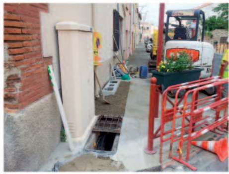
Mise en place de la fibre optique