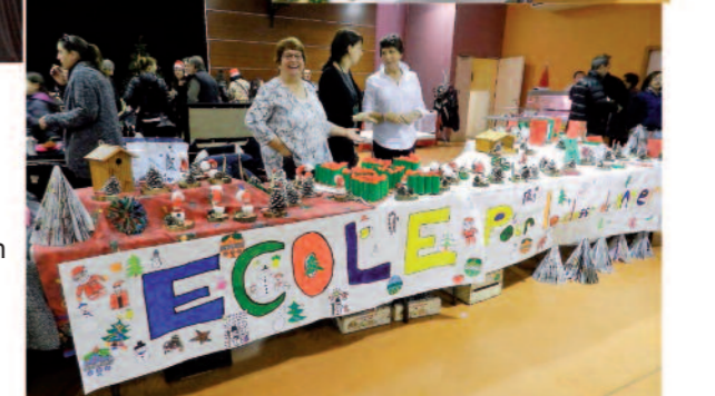
Marché de Noël