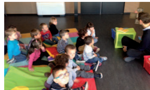
Une pause bibliothèque