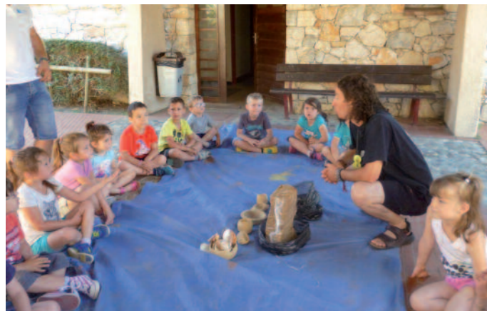
Une sortie au musée de Tautavel.