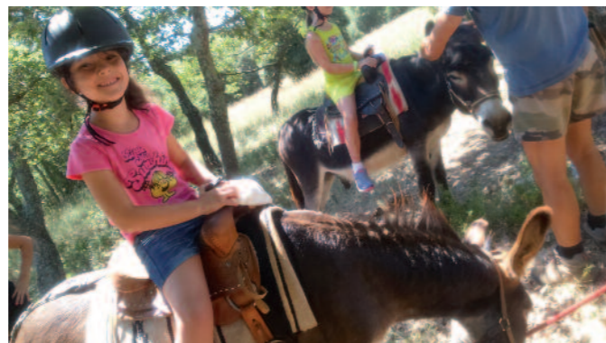
Promenade à cheval