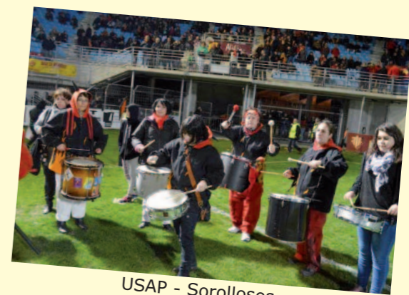
USAP - Sorollosos