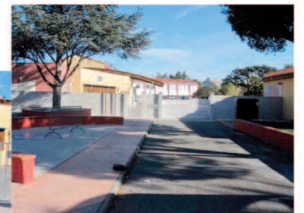
Travaux de mise en sécurité de l'accès à l'école élémentaire