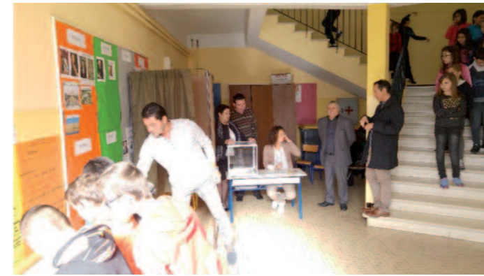
Election du Conseil Municipal