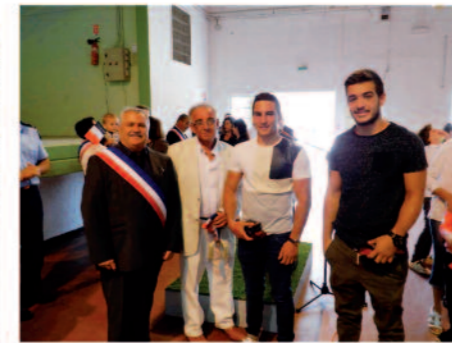
Remise de la médaille de la ville à nos Champions