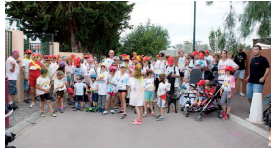
BAHO COLOR RACE