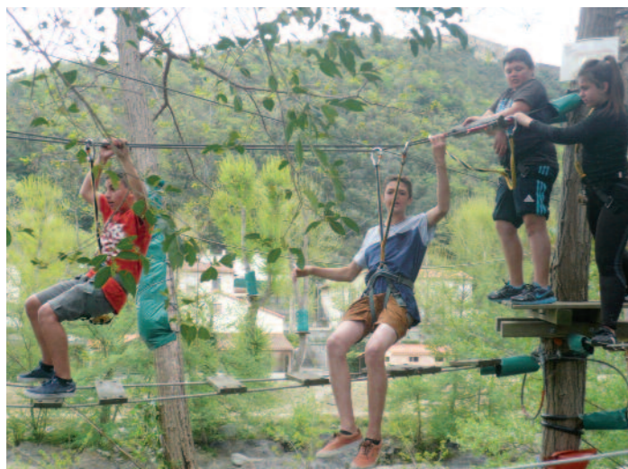
Accrochez-vous bien !