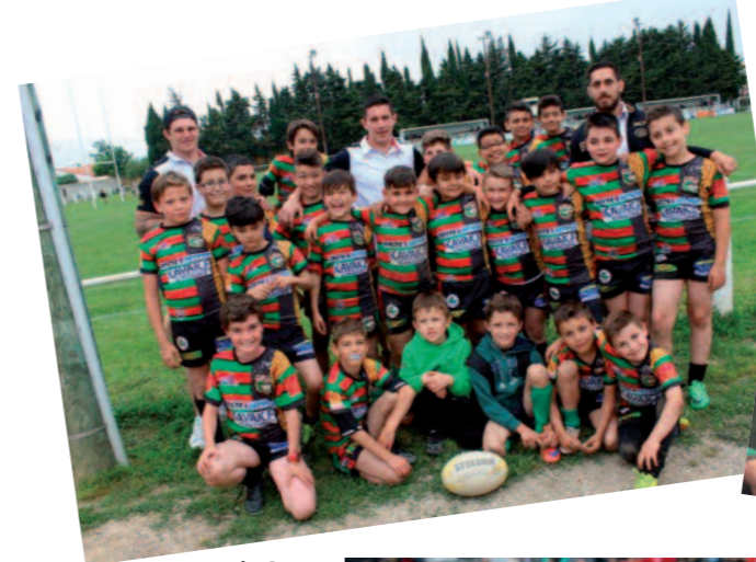
des Benjamins prometteurs