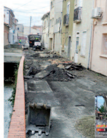
Travaux de mise en sécurité de l'accès à l'école élémentaire