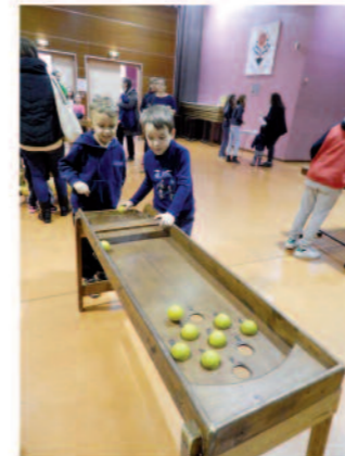
Marché de Pâques