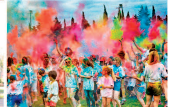
Baho Color Race