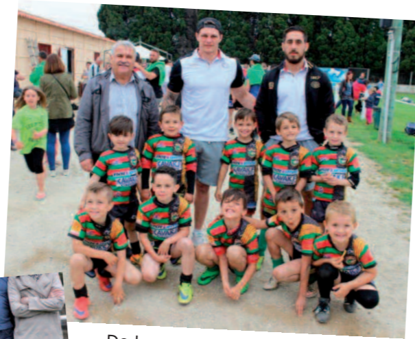
De beaux premiers pas