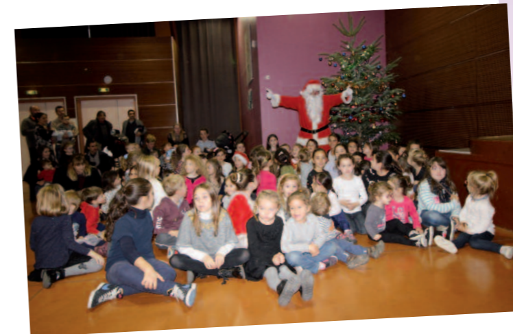
L'ARBRE DE NOEL