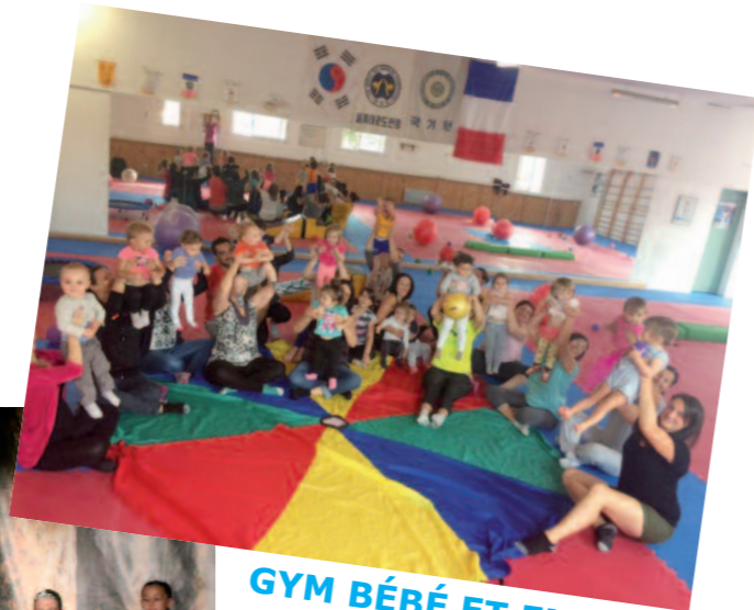
GYM BÉBÉ ET ENFANT