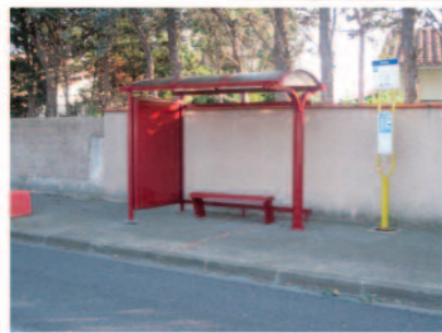
Réfection de l'entrée de l'église