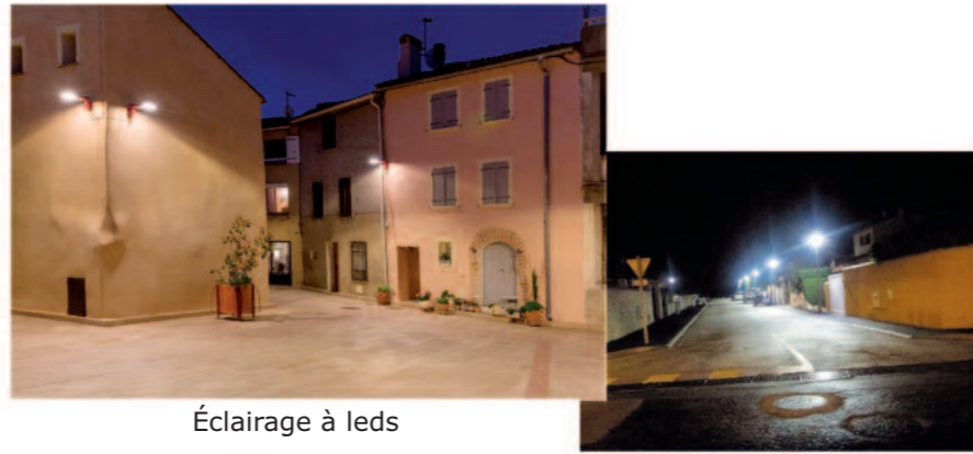
Éclairage à leds