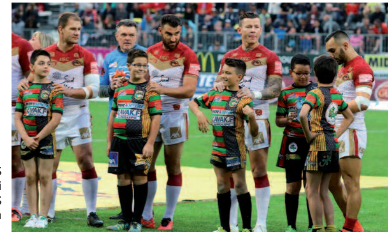
Petits GECKOS Aujourd'hui DRAGONS Demain