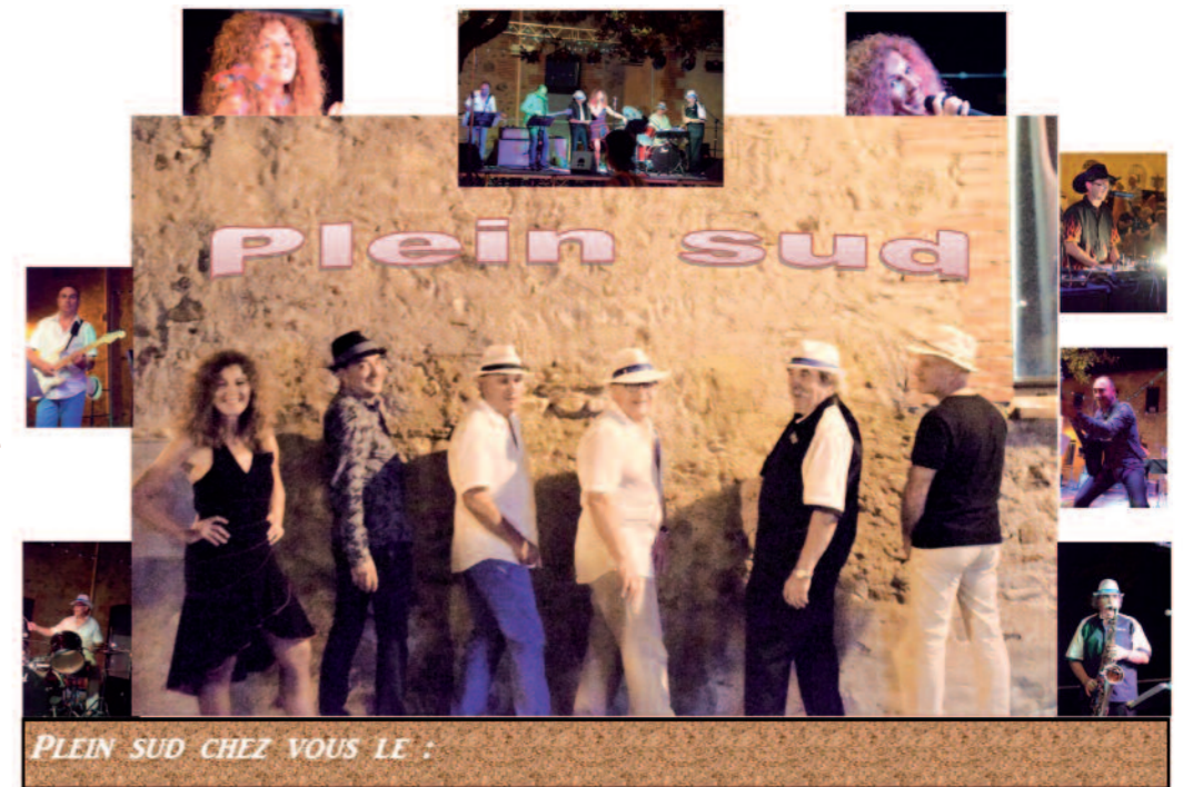
PLEIN SUD CHEZ VOUS LE :

La pelote du « Fil d'Ariane » poursuit son déroulement et permet toujours ainsi l'expression musicale