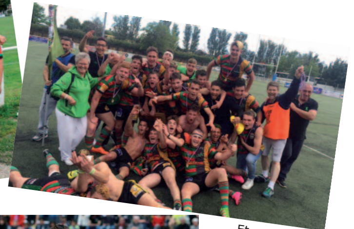
Et un Planchot, UN !