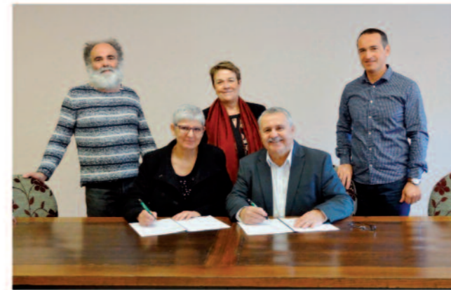
Signature de la convention avec les Francas