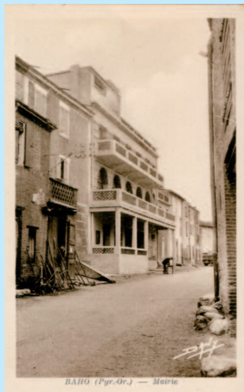
HÔTEL DE VILLE RUE DU BALL - 66540 BAHO