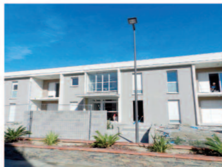
Livraison des appartements et maisons au Lot. Camp del Viver