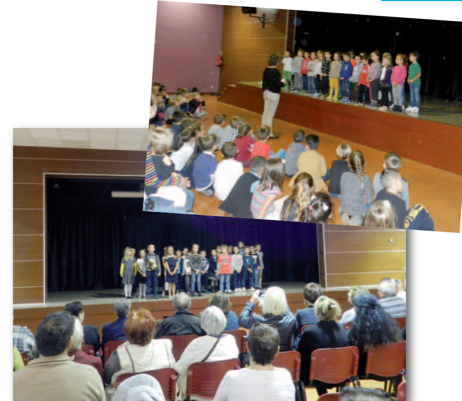
Les enfants et les aînés pendant la semaine bleue

Nous attirons votre attention sur le fait qu'il serait souhaitable d'avoir un nombre d'adhérents plus important afin que nous puissions renouveler cet atelier essentiel pour vous aider à bien vieillir.