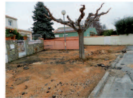
Travaux Rue des Roses