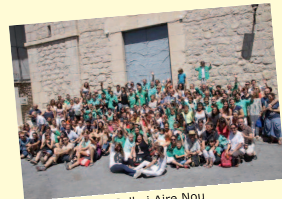
Sella i Aire Nou