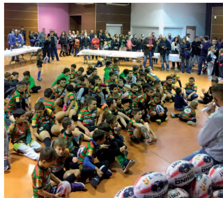
Un ballon pour chacun

Cette saison 2015-2016 aura permis au RC BAHO XIII d'atteindre son apogée.