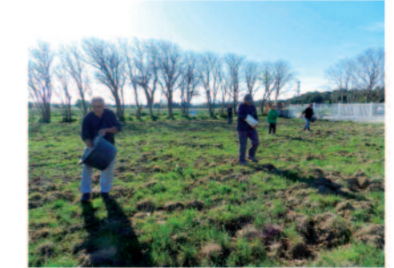
Travaux d'entretien de la nature. On sème